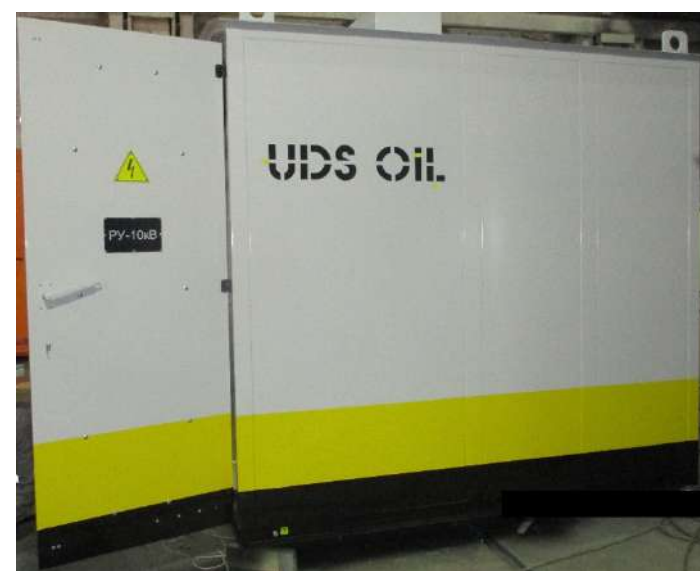
ООО «УДС нефть»