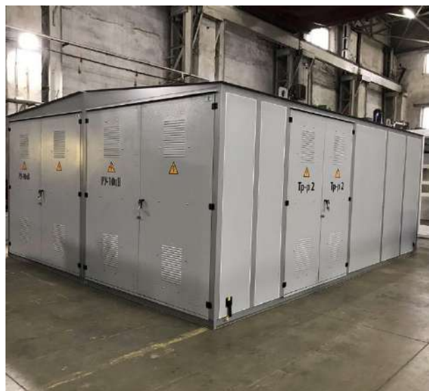
ООО «Энергопром Групп»