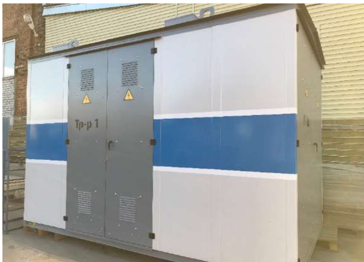
ОАО «Сетевая компания»