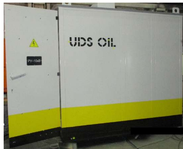
ООО «УДС нефть»